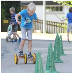
4 Beispiel: Slalom-Pedalo

Der vorhandene Spielekiosk soll mit ergänzenden Spielzeugen für den Außenbereich ausgestattet werden. Für noch mehr Bewegung und die Förderung der Koordination sollen auch verschiedene Fahrzeuge (z.B. Pedalo) beschafft werden. Durch die klare Abgrenzung von Nutzungsbereichen wird es möglich sein einen Rundkurs auf dem Gelände einzurichten.