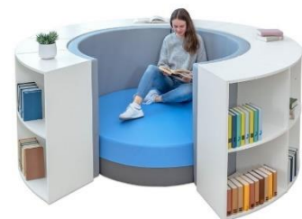
9 Beispiel Lesecke

Die bisher sehr funktionale Ausrichtung der Klassenräume soll aufgebrochen werden. In jedem Klassenraum soll eine Ruhe-/Lesecke eingerichtet werden. Diese kann je nach Raumstruktur in jedem Klassenraum individuell gestaltet werden. Die Umgestaltung soll unter Einbeziehung der Lehrer/innen und Schüler/innen erfolgen.