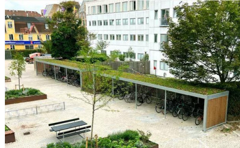
8 Beispiel: Begrünter Fahrradunterstand

Auf dem Schulhof steht aktuell ein in die Jahre gekommener Fahrradunterstand für Schüler/innen und Lehrer/innen zur Verfügung. Durch seine Einschubplätze ist er oft nicht gut nutzbar, da sich die Reifenbreiten in den letzten Jahren doch sehr verändert haben. Im Rahmen der Neugestaltung des Schulhofs möchten wir diesen Fahrradunterstand neu betrachten und in die heutige Zeit holen z.B. mit Fahrradbügel, einem modernen Design und der Möglichkeit Ladeinfrastruktur für E-Bikes/E-Roller und ggf. eine Dachbegrünung zu schaffen. So sollen ca. 50 moderne Stellplätze für Fahrräder entstehen.