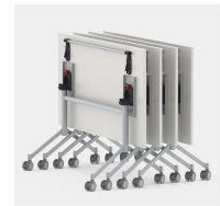
14 Beispiel klappbare Tische

Die Mensa (Essensausgabe per Durchreiche und Raum mit Sitzbereich) liegt gegenüber dem Kreativraum und wird aktuell fast ausschließlich für den Mensabetrieb genutzt. Dies liegt vor allem an der aktuellen Ausstattung. Diese ist zwar grundsätzlich für den Mensabetrieb gut geeignet, bietet aber wenig Flexibilität. Gern würde die Grundschule den Raum auch nach Abschluss des Mittagessens zur Gestaltung des Ganztagsangebots nutzen. Denkbar wäre daher hier die Neuanschaffung von flexiblem Mobiliar, wie z.B. klappbaren Tische.