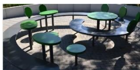
7 Beispiel: Grünes Klassenzimmer

Ergänzend zu der bereits vorhandene überdachten Lerninsel im Eingangsbereich der Schule möchten wir eine weitere Lerninsel oder ein sogenanntes grünes Klassenzimmer einrichten. Dieses soll durch seine Gestaltung als Sitzrondell und mit einer Tafel wie ein Klassenzimmer wirken.