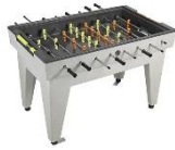
3 Beispiel: Tischkicker aus Beton

Bisher gab es eine robuste, fest installierte Tischtennisplatte auf der gepflasterten Fläche des Schulhofs. Diese wurde im Frühjahr 2025 auf Grund von Abgängigkeit abgebaut. Mit Blick auf eine zeitnahe Umgestaltung des Schulhofs wurde bisher kein Ersatz beschafft. Alternative zur Tischtennisplatte ist auch ein Tischkicker denkbar.