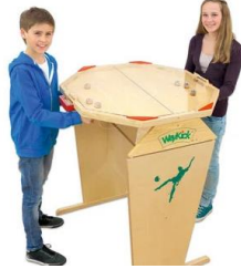
12 Beispiel Airhockey-Tisch

Der Gruppenraum liegt im ersten Obergeschoss der Grundschule, direkt über dem EDV- Raum. Bisher wird der Gruppenraum hauptsächlich als Gruppenarbeitsraum für Kleingruppen (z.B. DaZ-Unterricht) genutzt. Im Rahmen des Ganztagsbetriebs soll der Gruppenraum vollständig umgestaltet werden. Er soll sowohl für die Nutzung als moderner Unterrichts-/Gruppenraum, aber auch als Erholungsraum zur Verfügung stehen. Denkbar sind daher einige