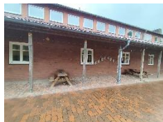
6 Picknicktische Schulhof Rethem

Die bereits vorhandenen Picknicktische sollen, je nach Zustand, ausgetauscht werden. Sie dienen bereits heute als Essplatz oder auch als „überdachte Lerninsel im Freien“ und werden von den Schüler/innen gut angenommen.