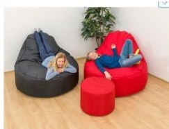
11 Beispiel Mobile Sitzelemente

Ergänzt werden sollen diese fest eingerichteten Ruhe-/Lesecken mit mobil einsetzbaren Elementen die sowohl in der Unterrichts- als auch in der