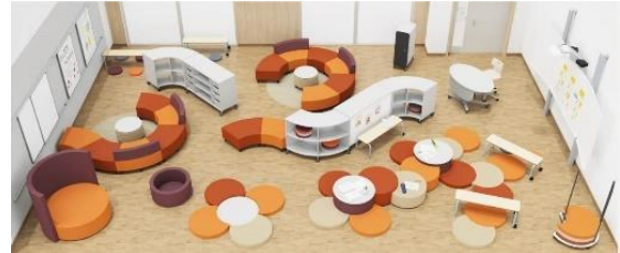
13 Beispiel Einrichtung Gruppenraum

Denkbar sind daher einige feste Elemente wie Sitzbänke, Tafel und ein Smartboard. Aber auch individuell platzierbare Elemente wie mobile Regale und Tische, Sitzmatten und Liegeelemente. Auch das Aufstellen von großen Spielmöglichkeiten wie z.B. einem Airhockey-Tisch oder einem großen Vier-Gewinnt-Spiel ist in diesem Raum denkbar.